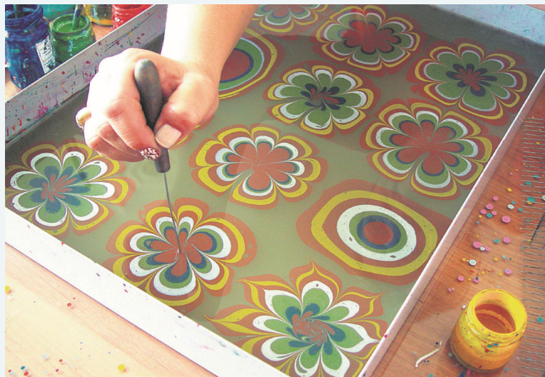
浮水染是歐斯曼帝國時期的一種藝術

歐斯曼書法家與藝術家使用浮水染來裝飾書籍、法令文獻、官方信函與文件，也讓新的型式與技巧更趨完善，使歐斯曼帝國在幾百年來一直是浮水染藝術的中心。現存最早的歐斯曼浮水染紙張是存放在伊