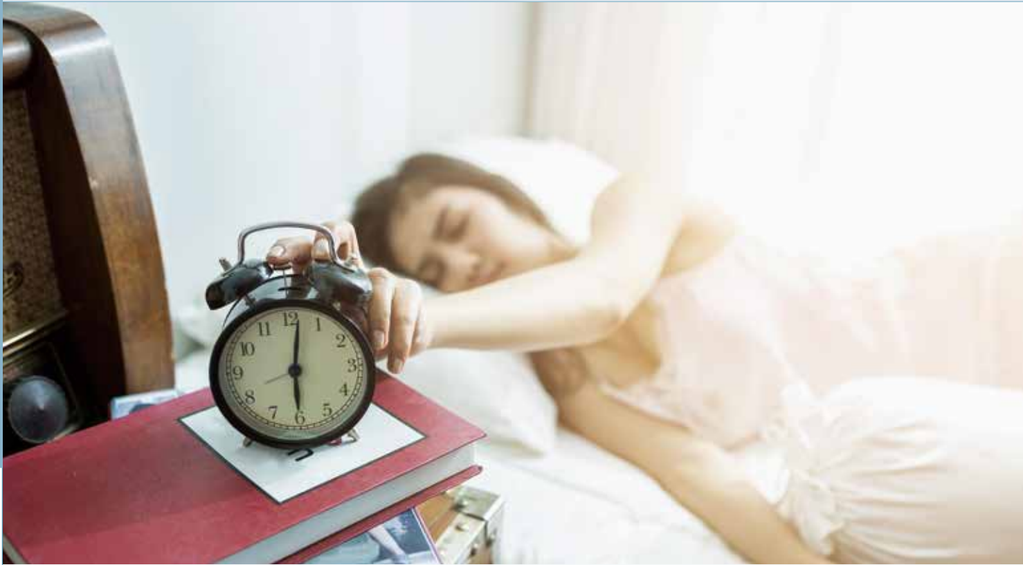
生理時鐘會因為生理變化與外在刺激改變而被打亂

家還要做功課、洗澡，怎麼可能早睡？」 「我家住那麼遠，每天都要五點多，天還沒亮就起床。」這些都是國高中生的真實生活。