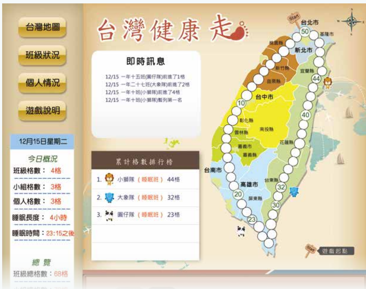
同儕互動與社群遊戲畫面

因此，對於青少年睡眠與網路成癮的問題已不容忽視，特別是夜貓型的學生。在教學現場，有許多老師認為手機的使用會影響教學品質，且是學生無法專心的主因，因此常透過消極性禁止的方式期盼能解決問題，但成效不彰。學生也經常開玩笑地說：「道高一尺，魔高一丈。」繳給老師的是家長的舊手機，上課或半夜口袋裡拿出來的卻是功能齊全、五光十色的新手機，防不勝防。