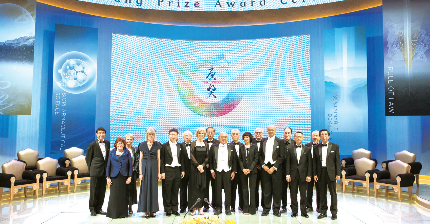
唐獎第二屆頒獎典禮

其他包括參加及支持美國臨床腫瘤醫學會及美洲華人生物科學學會（SCBA）的活動，簽署 MOA 支持國際生物化學及分子生物學會（IUBMB）的活動，安排歐洲生物化學聯盟（FEBS）唐獎演講等。