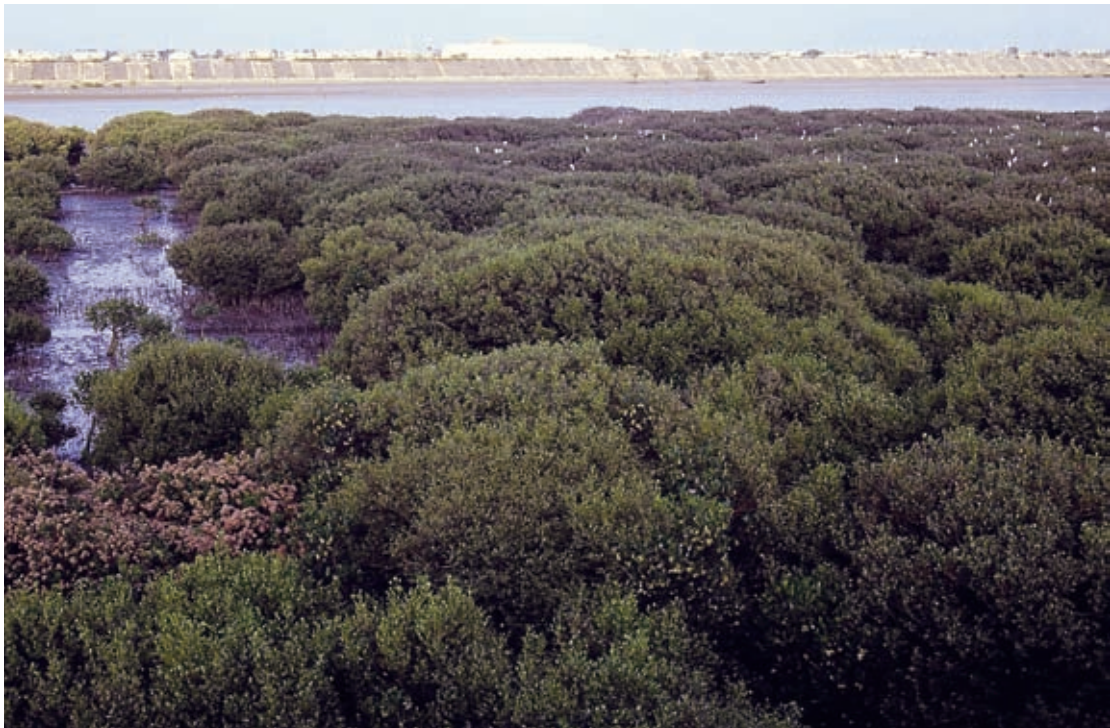
東石大橋兩側河岸堆積處已擴展成林的紅樹林

東石、塭港之間的紅樹林，主要因海埔地開發遭砍伐而消失，其他地區紅樹林的消失，則和海平面相對上升及堤防興建有關。嘉義沿海地區於 1987 年開始進行地層下陷監測，到 1993 年為止，累計最大下陷量已達 0.9 公尺，目前仍持續下陷中。在 2004～2007 年間，東石地區累積的地層下陷就高達 0.1 公尺。