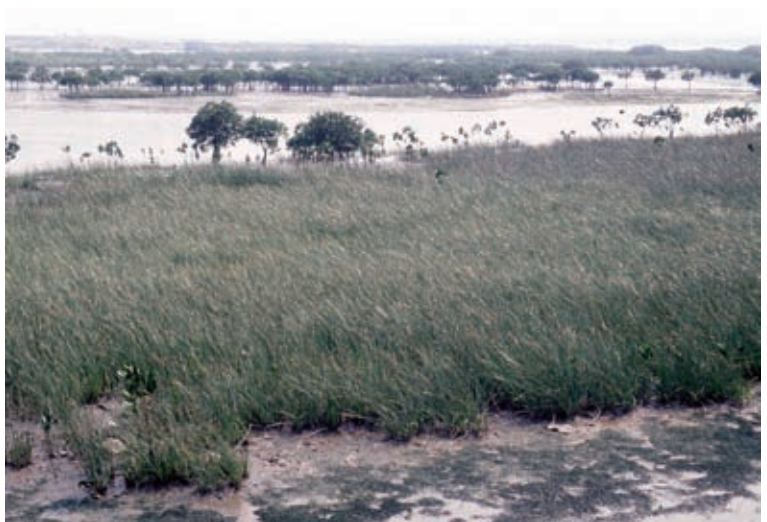
關渡濕地在 1984 年時是草澤景觀，仍有茫茫鹼草的分布，而水筆仔只零星分布於西端處。