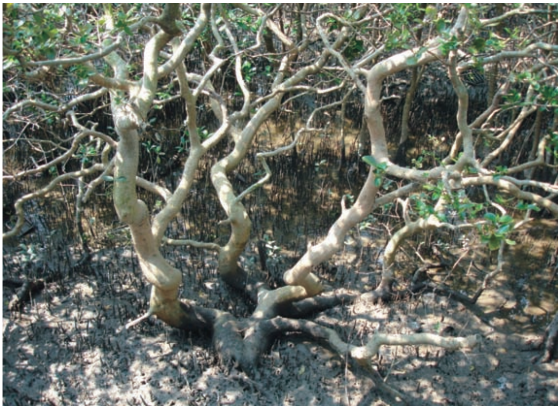
海茄苳植株下方的泥灘地中滿布的呼吸根