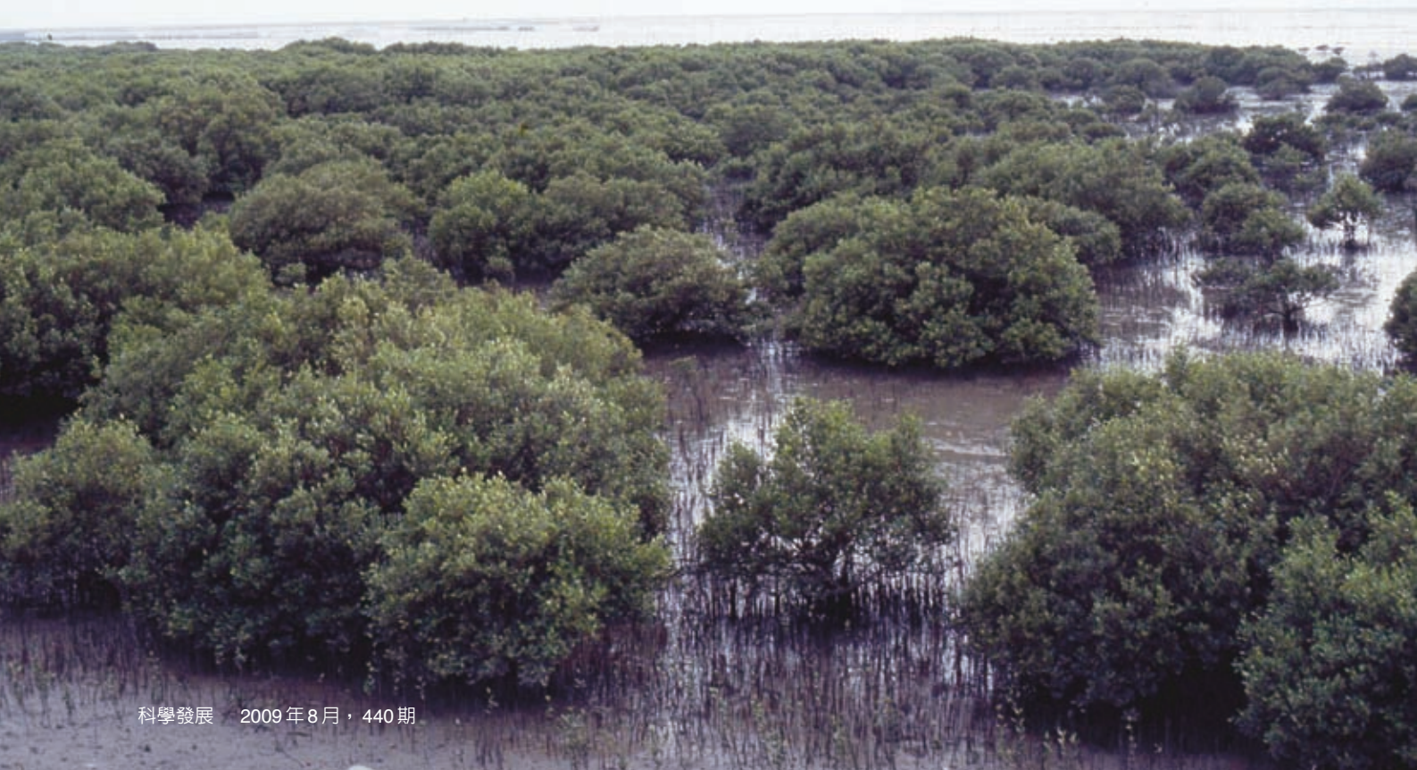
新結庄在1986年時仍有大面積的海茄苳紅樹林分布

從1989年起，新結庄的紅樹林面積也開始有縮小的現象，1991年之後就完全不見紅樹林的蹤跡。在短短一、二年之間就消失不見，變遷幅度相當驚人。