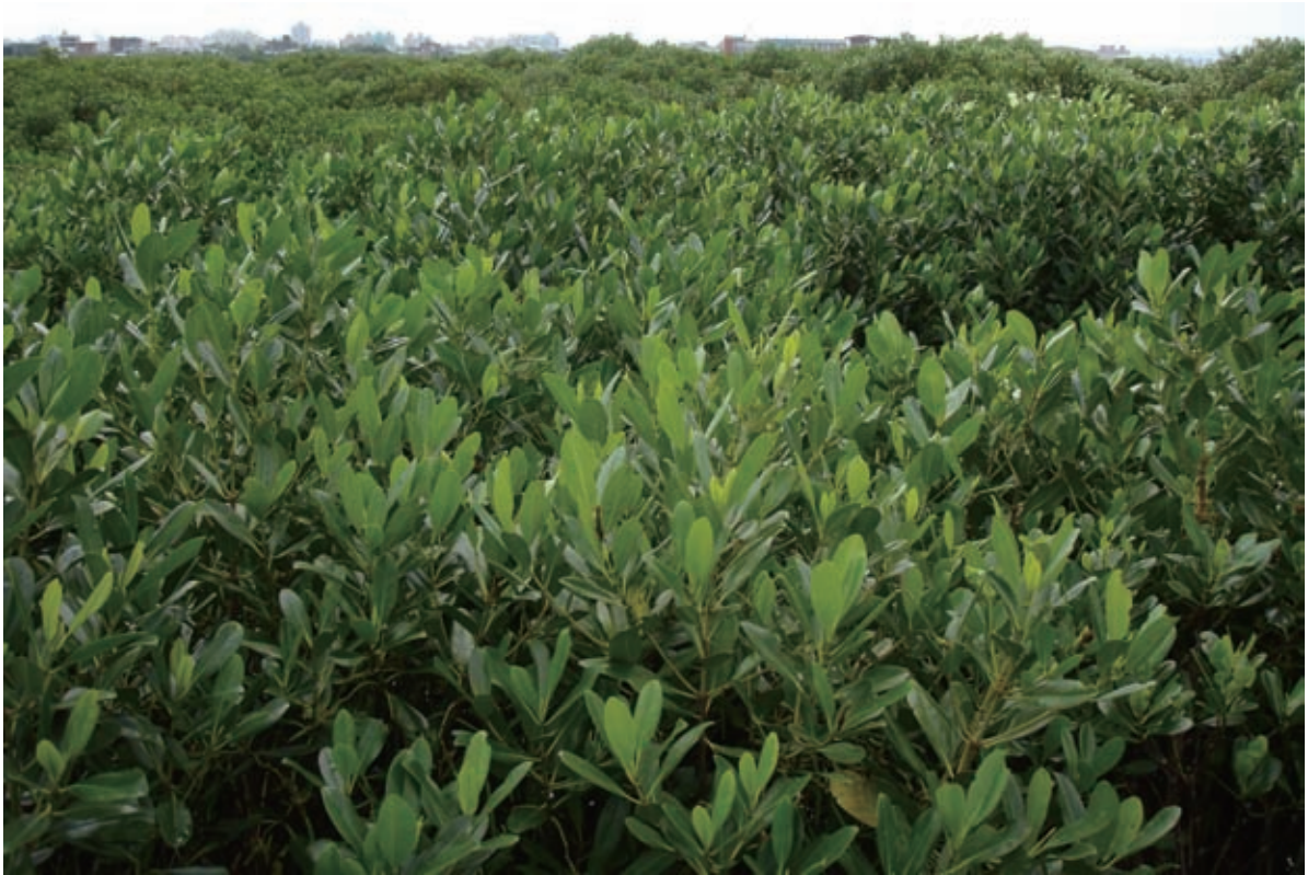
關渡濕地目前已發展成由水筆仔構成的林澤