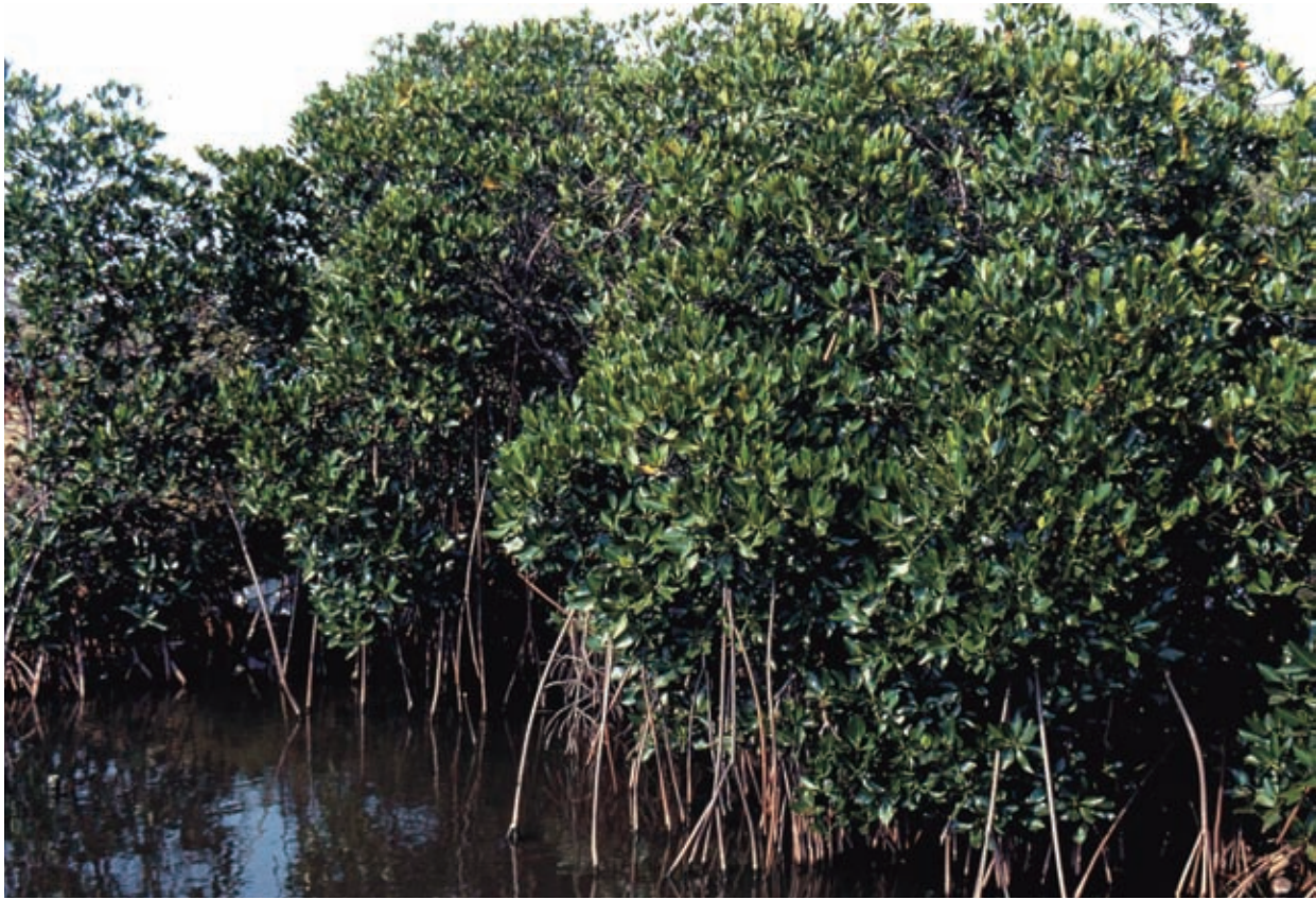
紅海欖的支柱根，形成初期有如榕樹的鬚根。