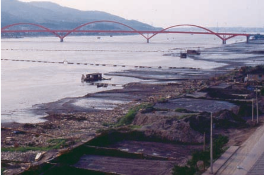
1984年在關渡仍可見到抽砂作業，不利於河岸堆積和水筆仔的擴張。

台灣地區沿海的地層下陷非常嚴重，已造成許多環境問題和災害，但也是了解海平面上升對沿海各種環境衝擊的最佳自然觀察場所。