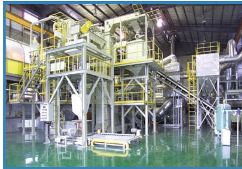
花蓮縣豐濱鄉都市垃圾RDF-5再生燃料示範廠

外觀與物性 廢棄物經分離、壓縮、乾燥後製造成為RDF-5，較原料源形狀更均一、更緊密，可節省運送成本，且較容易進料和運輸。RDF-5成品一般是以卡車運輸，運輸過程須避免雨水淋溼使其受潮變質。