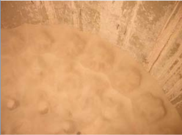
氣泡式流體化床鍋爐砂床流體化的情形