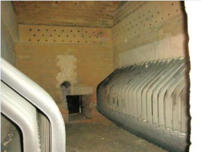
使用RDF-5的氣泡式流體化床鍋爐砂床內，具防磨片的垂直傳熱管。