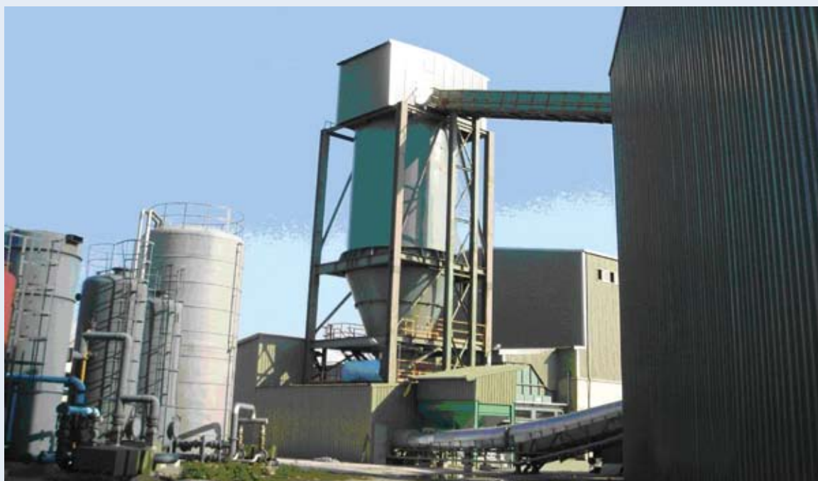
工廠生產RDF-5後輸送至儲存槽，再透過輸送系統送至汽電共生鍋爐使用。圖片上方輸送帶是把製造廠製造的RDF-5運送至儲槽。下方則由儲槽透過輸送帶，把RDF-5直接運送至氣泡式流體化床汽電共生鍋爐做為燃料使用。

分解腐敗性 RDF-5是經乾燥處理的廢棄物，依據日本TR規範，含水率要求在10%以下。此外，為了避免RDF-5受到微生物的作用而腐敗（尤其是含有廚餘的都市垃圾製成的RDF-5），除需注意儲存處須乾燥外，一般會在製程中添加石灰石或消石灰。石灰石或消石灰的添加主要是防腐敗，在燃燒過程中也