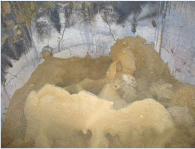
氣泡式流體化床砂床高溫結渣的情形