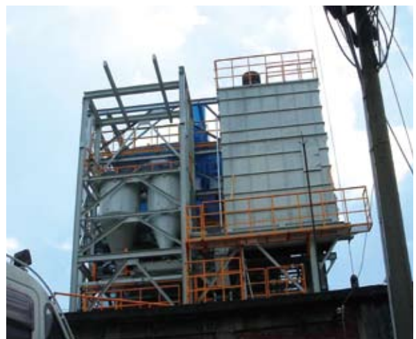
工研院所開發的RDF-5氣泡式流體化床蒸氣鍋爐，最大蒸氣產量是6公噸／時。