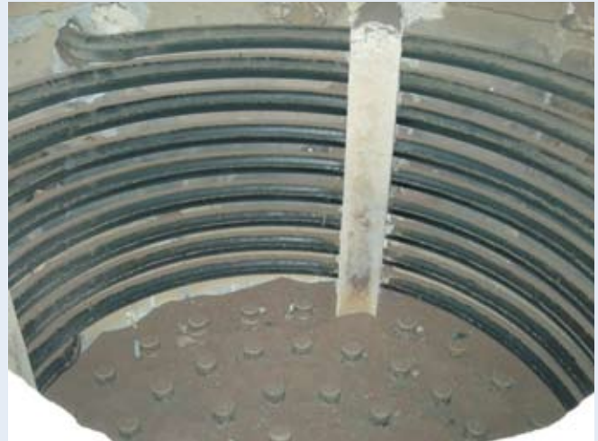
使用RDF-5的氣泡式流體化床砂床內的水平盤管式傳熱管

解（揮發分揮發）和燃燒。當揮發分燃燒後，固定碳再緩慢燃燒，因此底部空氣的分布是左右燃燒是否完全的關鍵因素。