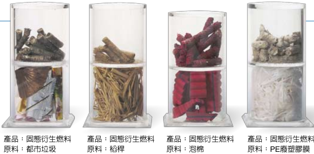
工業技術研究院由不同廢棄物所製作的RDF-5

體化床鍋爐。綜合測試結果顯示，既設鍋爐若不經修改，約可採用30%以下的RDF-5和煤炭混燒；若針對RDF-5設計的鍋爐，則可達到100%的燃燒，同時可達到系統穩定、各項汙染物排放都符合環保法規所訂的標準。