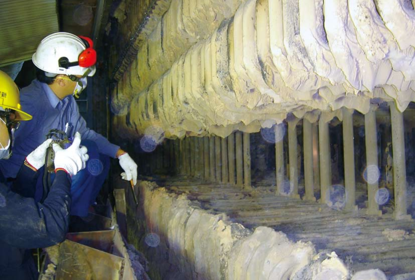
流體化床汽電共生鍋爐的對流區積灰情形

氣泡式流體化床鍋爐的燃料燃燒後的氣體溫度在攝氏850~1,000度左右，流經鍋爐內各階段的熱交換裝置（如過熱器、節熱器、空氣預熱器等），至煙囪排出大氣前的溫度約為攝氏150~170度，因此會對各項裝置產生不同的熱衝擊。