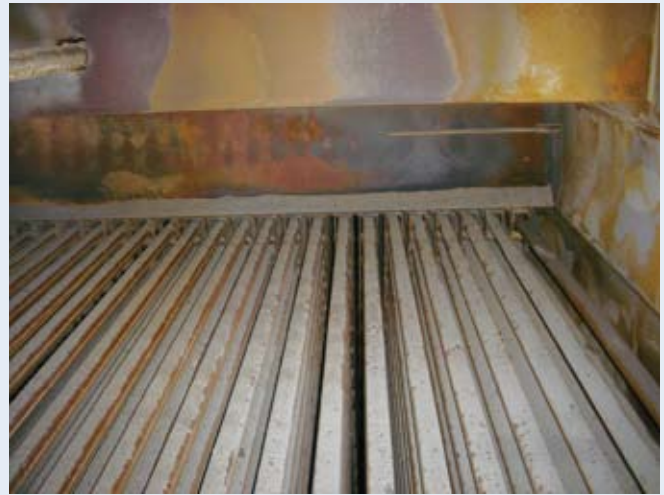
使用RDF-5的氣泡式流體化床鍋爐砂床內，水平多層布設的傳熱管。