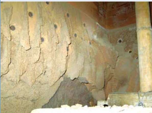
氣泡式流體化床蒸氣鍋爐耐火材內壁黏結積灰的情形

為避免氣泡式流體化床在燃燒RDF-5等高揮發分含量的生質物時，可能造成床砂溫度過高的危險，一般可採用床內設置熱傳管以移除過多的熱量。熱傳管的形式包括盤管型、水平管型及垂直管型，另外又可分為固定式、移動式等，可依不同設計者的理念而定。