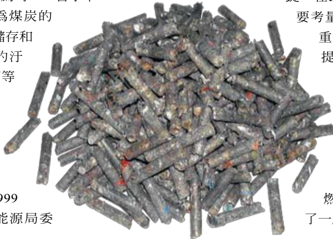
以紙廠廢紙排渣所製作的第五類廢棄物衍生燃料

工研院已分別在不同形式的多座鍋爐進行RDF-5與煤炭混燒和全燃燒的測試，也成功開發了一座RDF-5中小型氣泡式流