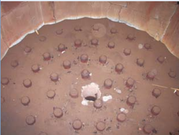
使用RDF-5的氣泡式流體化床鍋爐的鼓風口式氣體分布器