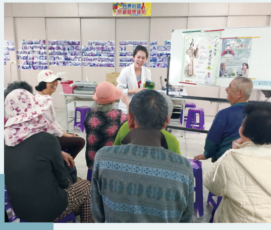
藥師進入社區宣導用藥安全，與民眾同樂。

藥師能充分了解醫師的處方意旨以及民眾的需求與期待， 在兩者間搭起橋梁，共同解決藥物治療問題。