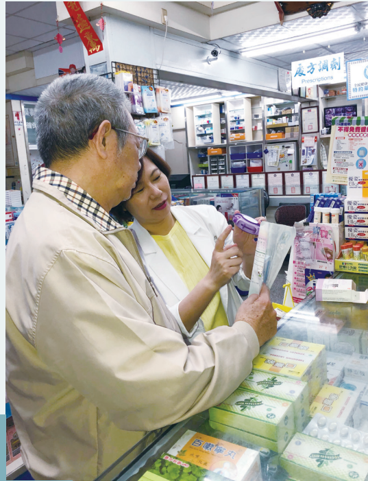
藥師交付藥品給民眾並指導用藥

藥師接受處方，必須進行用藥適當性評估，確認無誤後才能依處方把正確的藥交付出去（這過程稱為調劑）。因為只要