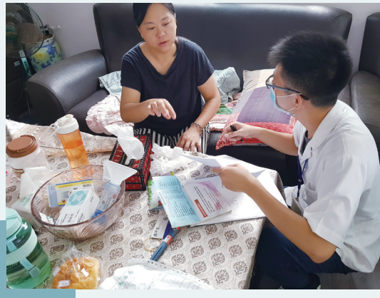
藥師幫忙整理用藥，走進民眾生活。

在營養照護方面，藥師能協同營養師評估長者的食欲不振是否為藥物造成，以及處理藥物與飲食間的交互作用。在進食與吞嚥照護方面，對於臥床或活動長期受限的長者，因為常有鼻胃管留置，藥師能評估藥物是否可以破壞其原有劑型給予管灌，並指導照顧者相關注意事項。