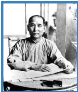
孫中山先生說：「管理眾人的事情就是政治。」

「甚麼是政治？」在東西方各有不同的演繹。在中國的政治觀中，孫中山先生在民權主義中定義說：「政就是眾人的事；治就是管理，管理眾人的事情就是政治。」因此，「政治」就是涉及以國家大權來管理全國人民的活動。在西方的政治觀裡，政治一詞導源於希臘文的「城邦」（polis），而古希臘人的生活形式以城邦為主。因此polis在西方語言中被譯為城邦，而城邦公民參與的統治和管理的活動就是政治。