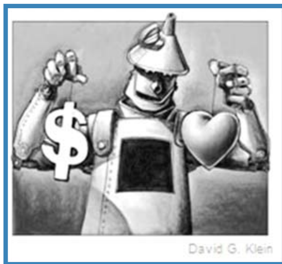
影響你思維的內心到底是什麼？經濟學家法蘭克在《紐約時報》的一篇專題中，用這樣一張圖來說明，處處斤斤計較、理性自利的人性假定其實有其限制。（圖片來源：紐約時報網站，網址： http://www.nytimes.com/2008/02/10/business/10view.html ）

其次，選民之所以會做出「去投票」的決定，最關鍵的考量並非是期待自己能夠獲得那個很低的預期效用，而是避免自己最害怕的遺憾出現，稱為「把最大遺憾出現的可能性壓到最小原則」。而在選舉中所謂的「最大遺