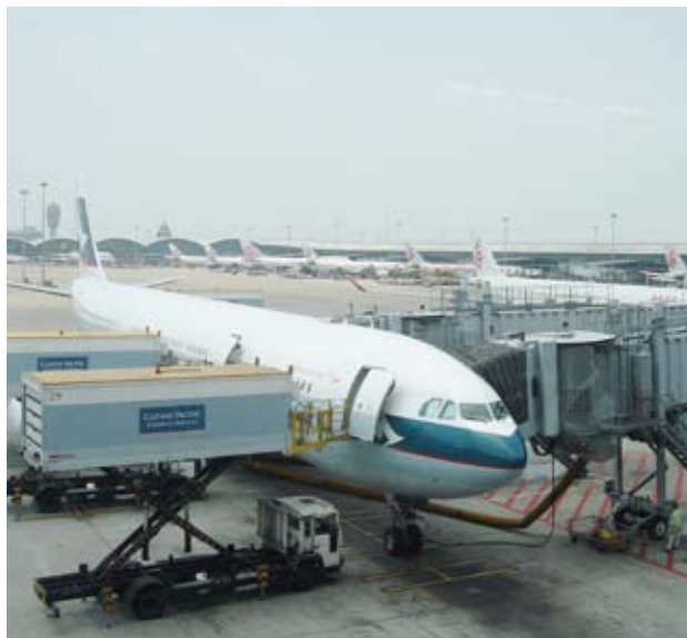
每次選舉都有許多居住在國外的國人搭機返國投票

然而，實際的情況是，我國每次選舉都有7成左右，甚至到8成（約1千4百萬人）的選民投票，