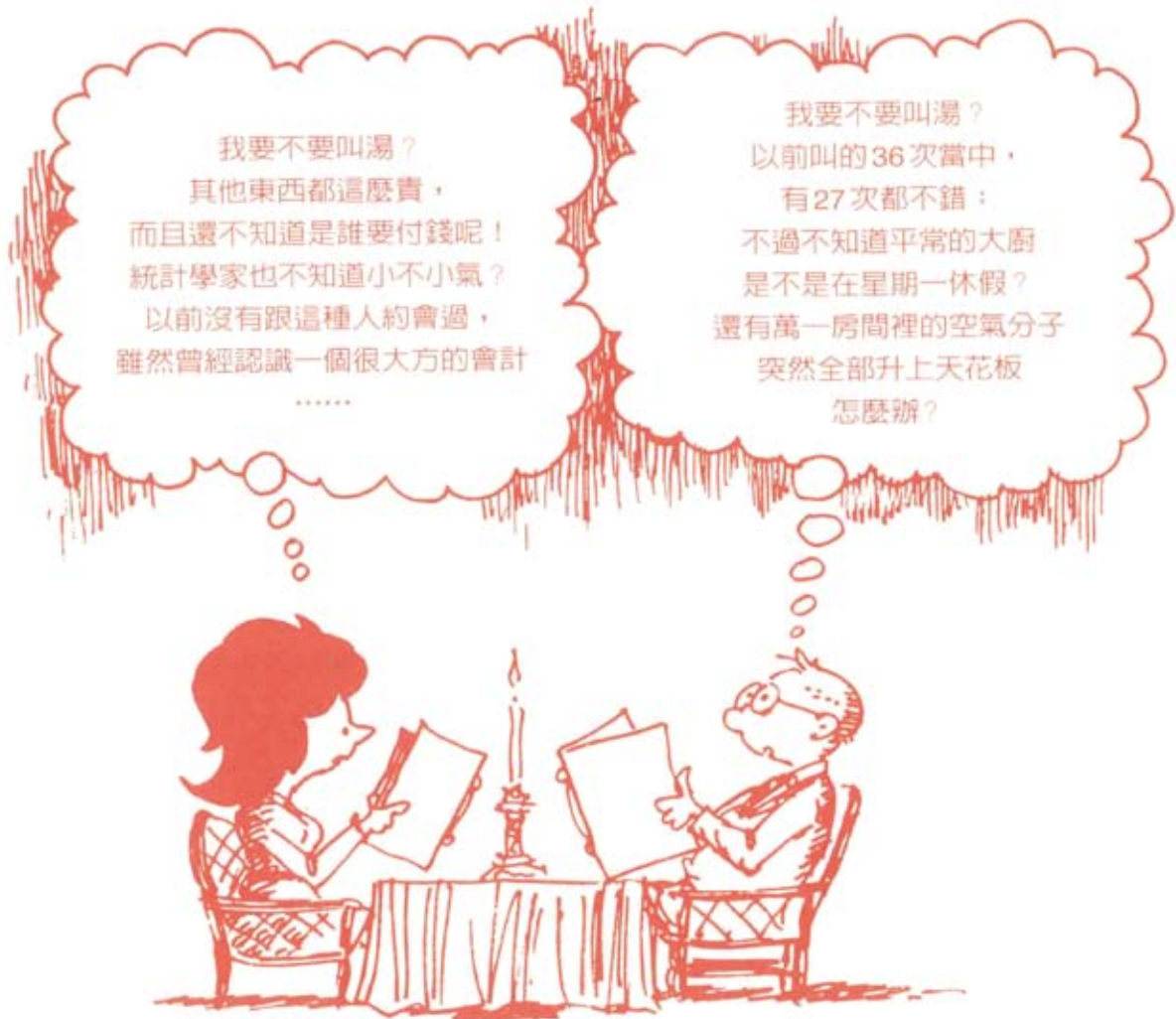
一個「理性」的人即使在餐廳點餐，也會清楚地「計算」各種可能的利弊得失（圖片來源：Larry Gonick and Woolcott Smith (2003)，看漫畫·學統計（鄭惟厚譯），天下遠見出版公司，台北。）

感，理性的人還是會因為預期效用很低，甚至低於必須支出的成本總和（出門忍受溼冷、麵價等），而選擇待在家裡繼續挨餓。