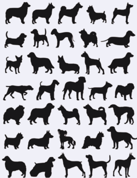
家犬的品種這麼多，牠們同出一源嗎？