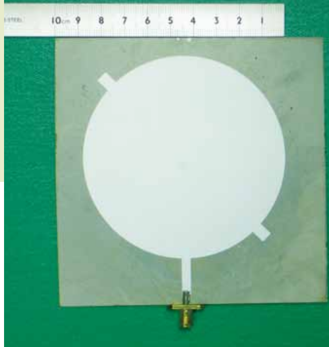
利用自行開發的 PEI / 陶瓷所做成的 RFID 天線。

一個電容器要能夠有高電容值，基本上有3種方法。第一是增大面積，這和現今希望輕薄短小的3C產品目標牴觸，因此一般不採用；第二是提高介電係數，一般有機物的介電係數是2~4，而在使用陶瓷，甚至加入奈米碳管後可提升，楊教授的研究成果則把複合材料的介電係數提高到25左右；第三個方法是降低介電層（印刷膜）的厚度，由於微米級的陶瓷顆粒還不夠小，因此近年來楊教授更朝向奈米（ 10^{-9}\text{m} ）級邁進。然而這種奈米級的陶瓷粉末在自然狀態下傾向聚集成較大的粒子，要加入特殊的分散劑才能避免聚集，以保持奈米的顆粒大小。