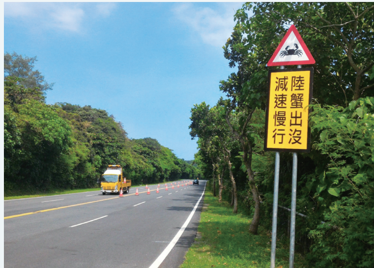
墾丁省道台26線的「陸蟹出沒、減速慢行」警示牌。

路殺是指野生動物遭到車輛撞擊或輾壓死亡的事件，也就是野生動物的車禍。而路殺社一開始的宗旨，就是一個調查和記錄全台灣野生動物車禍事件發生日期、地點與物種種類的公民科學計畫。這是何等奇怪啊？！當別人是帶著望遠鏡或數位