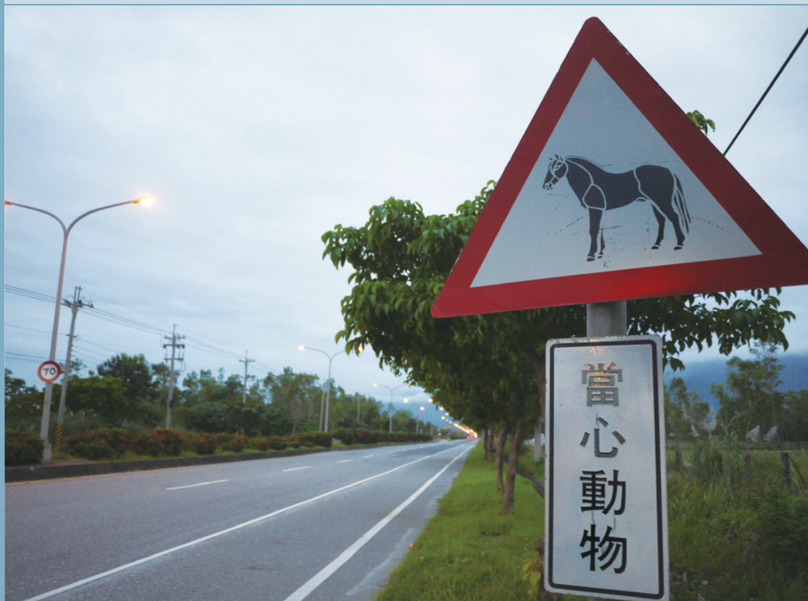
花蓮縣壽豐鄉省道台9線的「當心動物」警示牌。

為了降低臉書的制肘、掌握資料控制權，又希望保有臉書平台的快速反應與高連結性優勢，這計畫重新規劃資料流動的 SOP（標準作業流程），重新開發 APP 及路殺社官網線上上傳介面，讓參與者上傳的資料不再是直接在臉書社團貼文打卡，而是讓資料直接進入資料庫中。資料庫接收到資料後，再由系統自動給與每一筆紀錄唯一的編號，並把這編號連同照片及詳細內容以統一的格式同步發布至臉書社團，以利後續的資料鑑定、檢覈與審查工作，確保資料的正確性與品質。