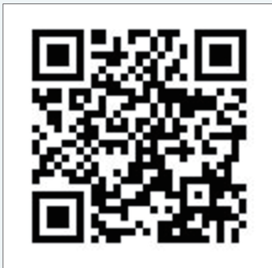
路殺記錄 web APP（透過瀏覽器且可跨系統使用）。

累積。然而臉書近年來頻繁更動各項重大政策，嚴重干擾了以程式自動化協助整理所蒐集的資料，同時造成依附其下的 APP（行動應用程式）無法正常運作，大大增加資料庫維護的工作量及成本。