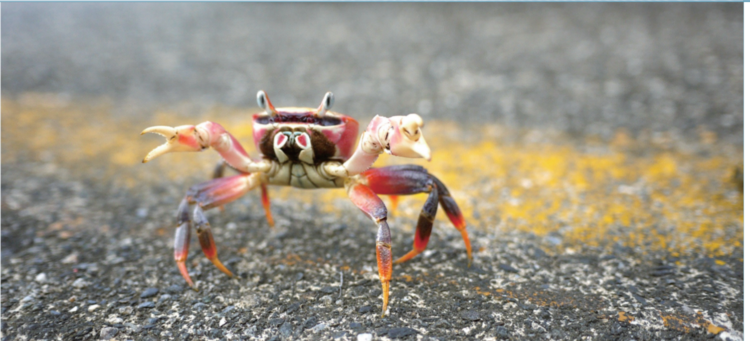
陸蟹是台灣極易受路殺威脅的種類之一