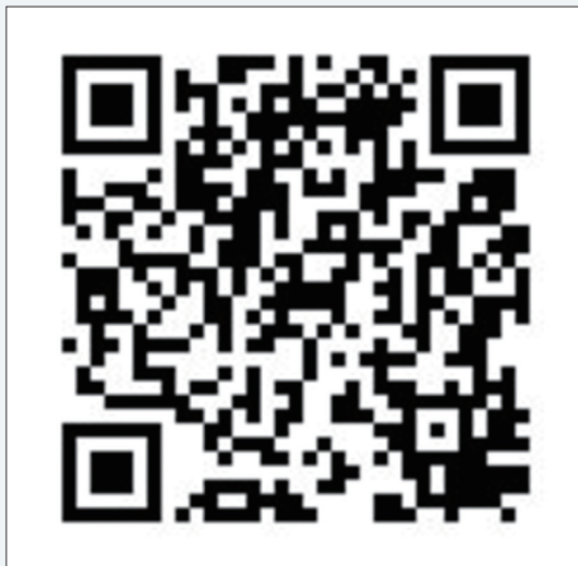
路殺記錄行動應用程式（限安卓系統使用）。