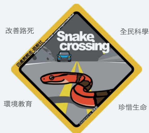
路殺社 Logo 及 4 大宗旨

成各式猛禽、候鳥或野鳥誤判而不慎撞擊，導致受傷甚至死亡（簡稱「窗殺」）。還有許多人們隨手丟棄的釣魚線、魚網、尼龍繩纏住路過的鳥類或爬行類，導致動物餓死、窒息或曬死。