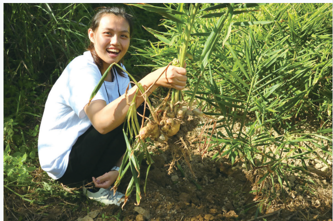
偏鄉學生參與農作種植，有助於激發畢業後回鄉就業安居的意願。

社會資本不僅對偏鄉社區經濟、產業及人文情境的改善有其重要性，也是強化社區生活品質及永續經營的重要元素。以