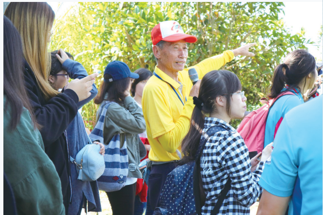
農村長輩帶領在地學生講述社區人文、經濟、產業的發展史。

社會資本不僅對偏鄉社區經濟、產業及人文情境的改善有其重要性，也是強化社區生活品質及永續經營的重要元素。