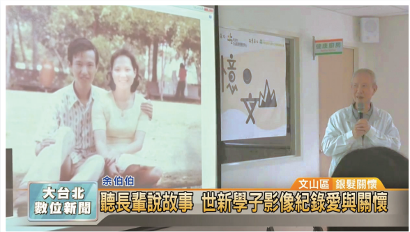
長者參與的媒體再現