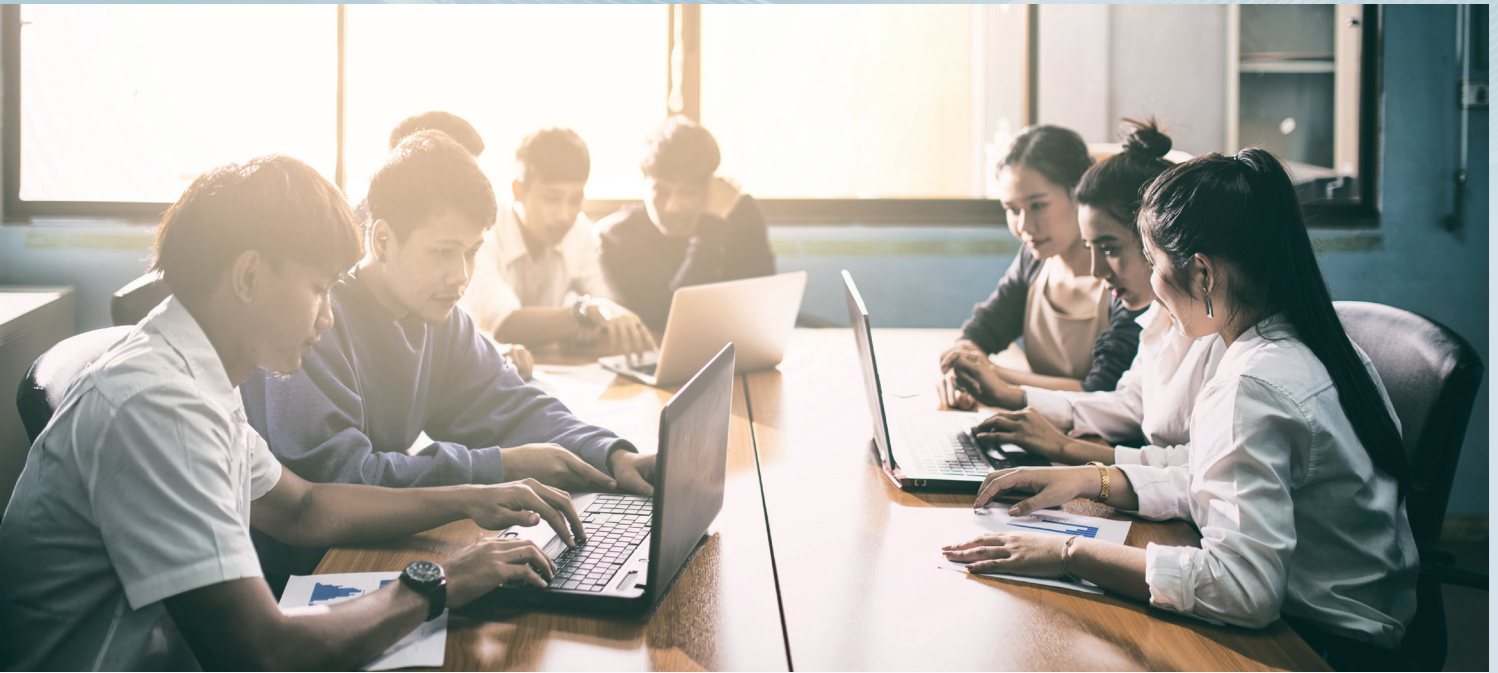
利用網路共享教育資源已是不可逆的國際趨勢

平台及台灣全民學習平台可以共享課程，成為全球第一個可以共享課程的磨課師平台設計，至今兩個平台已經成功共享超過 400 門課程。