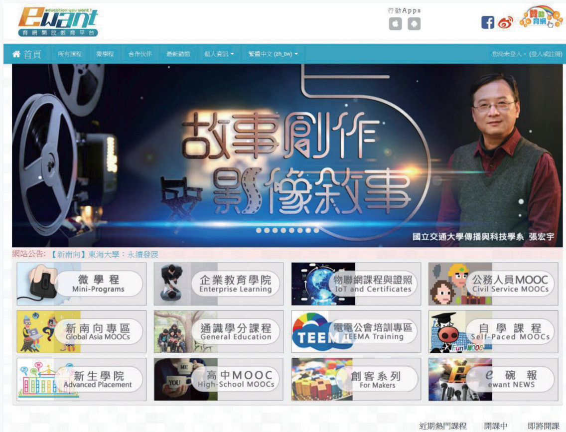
ewnat 育網開放教育平台首頁

但一個成功的磨課師平台除了服務開放教育的需求外，也必須積極嘗試及開發各式深化使用磨課師或數位學習的模式。如果磨課師只是局限在開放教育的雲端，最終難逃煙消雲散的命運，必須形成一個健康的線上學習生態體系，磨課師才有持續發展的機會。基於這樣的理念，育網平台從 2015 年起就開始積極嘗試及開發各式深化應用磨課師及線上課程的模式，其中包括：