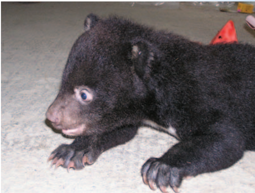
剛會爬行的兩個半月齡黑熊幼仔

黑熊在亞洲其他地方所遭逢的命運和台灣相差無幾，各地的數量和分布範圍都有減少的趨勢。因此，在管制野生動物國際貿易的「瀕臨絕種野生動植物國際貿易公約」（又名華盛頓公約組織，CITES）中，黑熊被列為附錄 I 等級的動物，明白規定禁止任何商業性交易，否