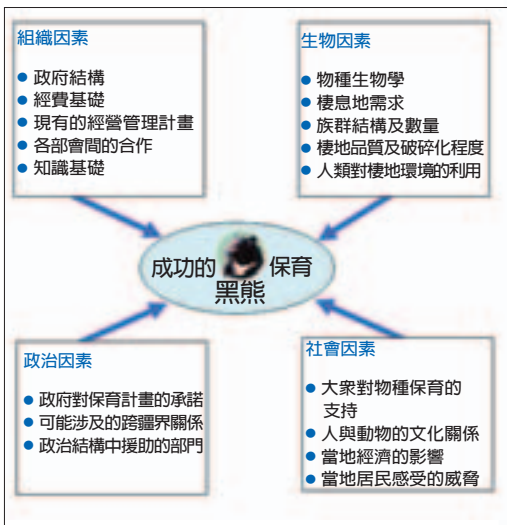
成功的熊類保育計畫所應強調的議題

是美國早期移民大規模屠殺的受害者。了解這些動物與人類的互動關係，就成為消弭二者衝突的重要關鍵。畢竟人們對於動物的刻板印象