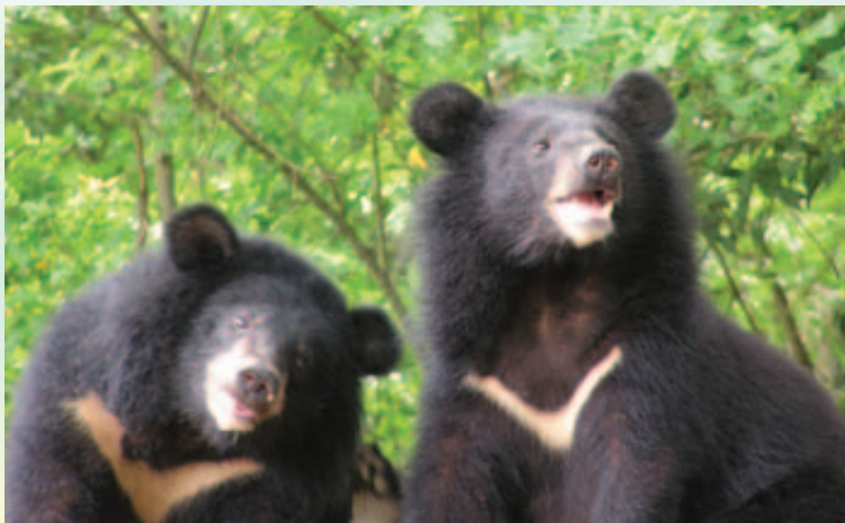
瀕臨絕種的黑熊是台灣陸地上最大型的食肉動物