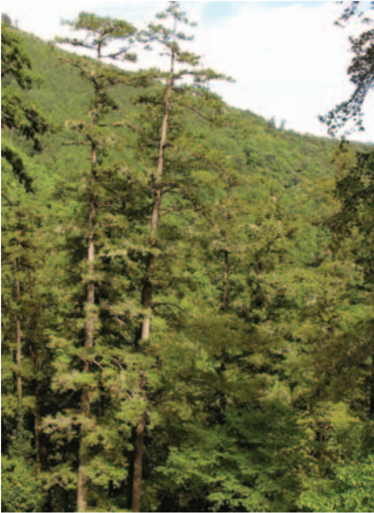
蓊鬱的山林是台灣黑熊的故鄉

和誤解，往往是動物遭受莫名殘害的主因，黑熊便是一例。當然，人類對於生存在同一塊土地上其他動物的包容力，也試煉著我們生態保育的決心與智慧。