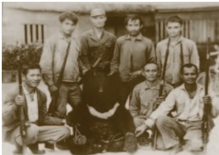
非法狩獵是威脅黑熊存續的主因

人們常會問：「遇到熊該怎麼辦？」其實黑熊一般不會主動攻擊人，因此與熊不期而遇時，最適當的反應莫過於在不驚擾牠的前提下，安靜地離開現場。「保持距離，以策安全」就成了人熊共存的最高指導原則。