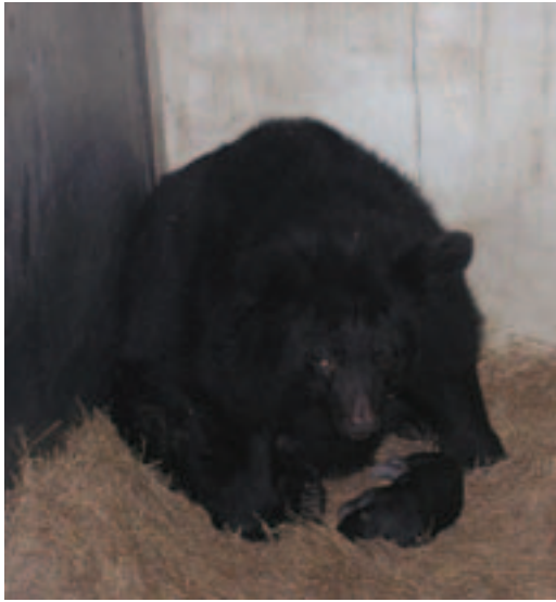
台灣黑熊生殖率低，幼獸晚熟。