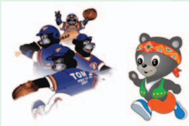
世界盃棒球賽（左）和全國原住民運動會（右）的吉祥物——台灣黑熊。

近年來，台灣黑熊的「人氣指數」逐漸增加，但是一般人對於這種被列入保育類的本土珍稀、最大型的食肉類動物的了解，其實十分有限，有時還充滿誤解。甚至因為曝光率增加，反而讓人誤以為台灣黑熊的保育進展順利，而產生黑熊越來越多的錯覺。這些誤解會成為未來保育瀕危物種的阻礙。