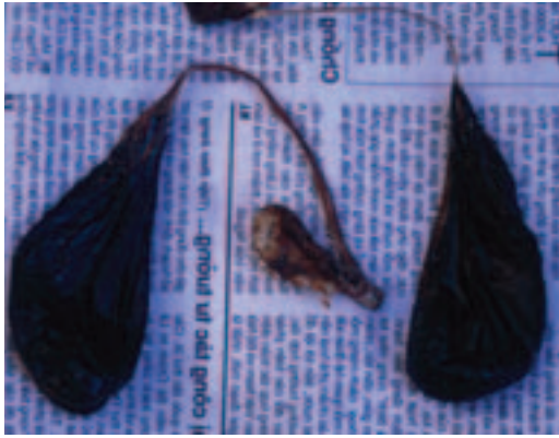
中藥熊膽的使用讓黑熊身陷重重殺機

腦，喝血補血，食鞭補陽，無病也可強身。由於這樣的文化觀點，或許就不難解釋有人於調查台灣消費者飲食行為後指出，有半數民眾曾吃過山產，而嗜吃山產的原因，不外乎是爲了進補、美味、好奇。至於黑熊在市場上高價位的主因，當然是因爲其稀有性和進補藥性。