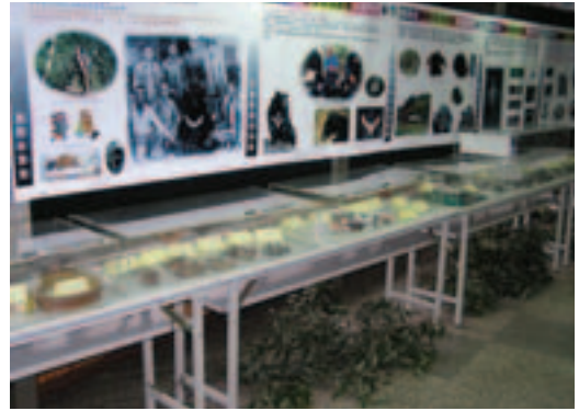
玉山國家公園推展瀕危物種的保育教育宣導