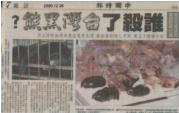
非法獵殺黑熊的新聞仍時有耳聞

則會嚴重威脅該物種的存續。另外，世界自然保育聯盟（IUCN）也把它們列為紅皮書上的「易危物種」，表示如果迫害族群的因素繼續作用，在短期內會面臨滅絕的困境。