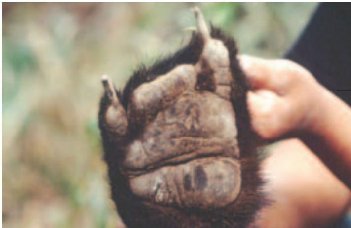
誤中陷阱受傷的台灣黑熊斷掌

台灣非法狩獵黑熊的情況，在玉山國家公園歷時3年的捕捉繫放研究中，更出現令人擔憂的結果。研究中捕捉到的15隻黑熊，便有8隻有斷掌或斷趾的情形，這是黑熊過去曾被獵人陷阱捕獲再逃脫的證據。這也昭顯非法狩獵對原本數量已經十分稀少的黑熊，可能產生的致命影響，實不容我們等閒視之。