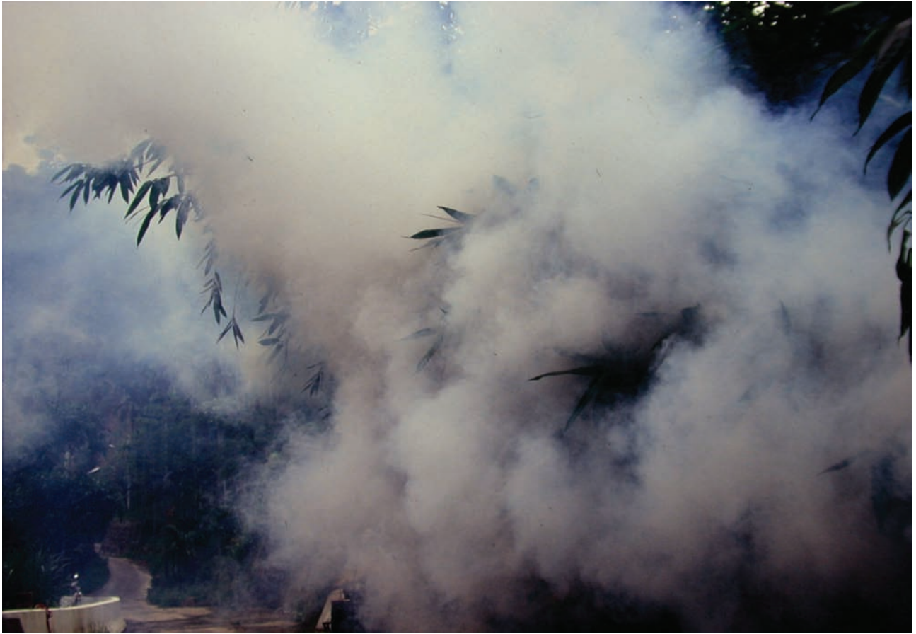
在天候情況適宜的條件下，利用熱煙霧機進行竹林小黑蚊防治藥劑的空間噴灑工作，藉由機器所噴出大量含藥的可見白煙，撲殺棲息及活動的成蟲。

陰暗處的青苔表土及腐植質，拆除不必要的遮蔭棚架；翻土可讓表土層保持乾燥，以減少幼蟲存活的機會及成蟲產卵處所；清除雜草堆、灌木叢與疏伐樹枝，可消除或減少成蟲的棲息場所。