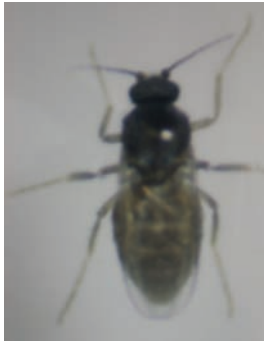
小黑蚊體色黑褐，雌成蟲觸角上具稀疏的短毛。

有明顯延長的現象。雄蟲的觸角上生有長毛，也就是呈鑲毛狀，僅末端4節明顯延長。另外，雄蟲腹部末端有1對基節粗大的把握器，可以讓交配的過程順利進行。