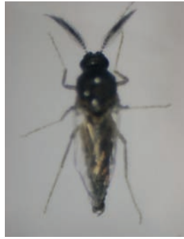
雄成蟲觸角上生有長毛呈鑲毛狀，腹部末端有1對把握器以協助交尾。