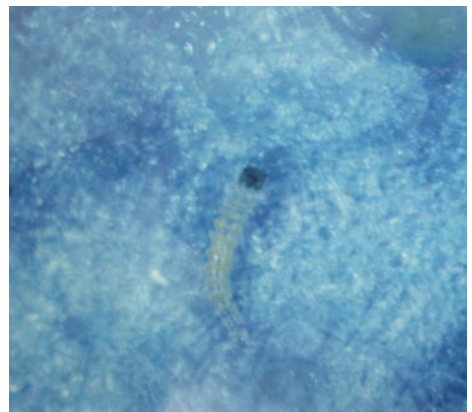
初齡幼蟲頭部褐色，體色淡黃、略透明。