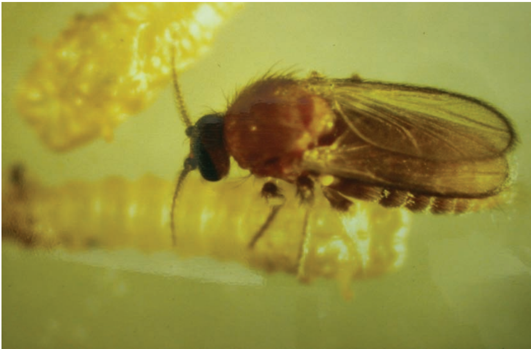
剛羽化的雌成蟲是淺褐色。

漸減少，至黃昏時則完全消失，其中以12～15時吸血活動最為活躍。成蟲飛行活動時，一般距離地面不超過兩公尺，大約是一個人的高度。孳生場所的500公尺半徑範圍內，是主要的活動地區。