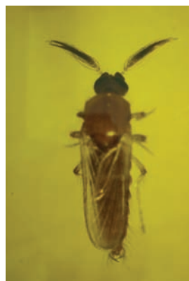
剛羽化的雄成蟲是淺褐色。

在台南地區，從11月至次年2月間，小黑蚊雌成蟲密度一般較低，4月至5月及7月至10月各有一個高峰期，而以9月分的族群密度最高。台灣鈹蠓雌成蟲族群密度的變動，主要與上一個月的降雨日數、溫度及降雨量有關，且與當月溫度也有顯著的正相關。