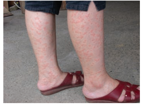
小黑蚊成群叮咬人體裸露的皮膚，受害部位隨即紅腫，奇癢難耐。嚴重的地區，居民的日常生活深受其擾。