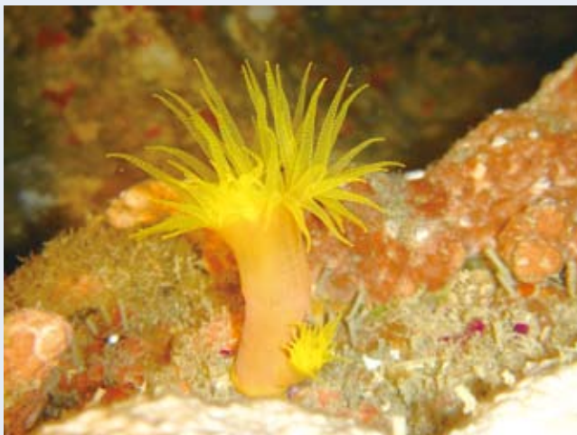
圓管星珊瑚的出芽生殖 新的小珊瑚蟲在原珊瑚蟲外體側處形成，這種無性生殖可以使珊瑚蟲的數目快速增加。

珊瑚的性別有雌雄同體及雌雄異體兩大類。雌雄同體的珊瑚體內同時擁有雌性及雄性生殖腺，雌雄異體的珊瑚則可區分為雌株及雄株珊瑚，分別擁有雌性及雄性的生殖腺，大多數的石珊瑚屬於雌雄同體型珊瑚。