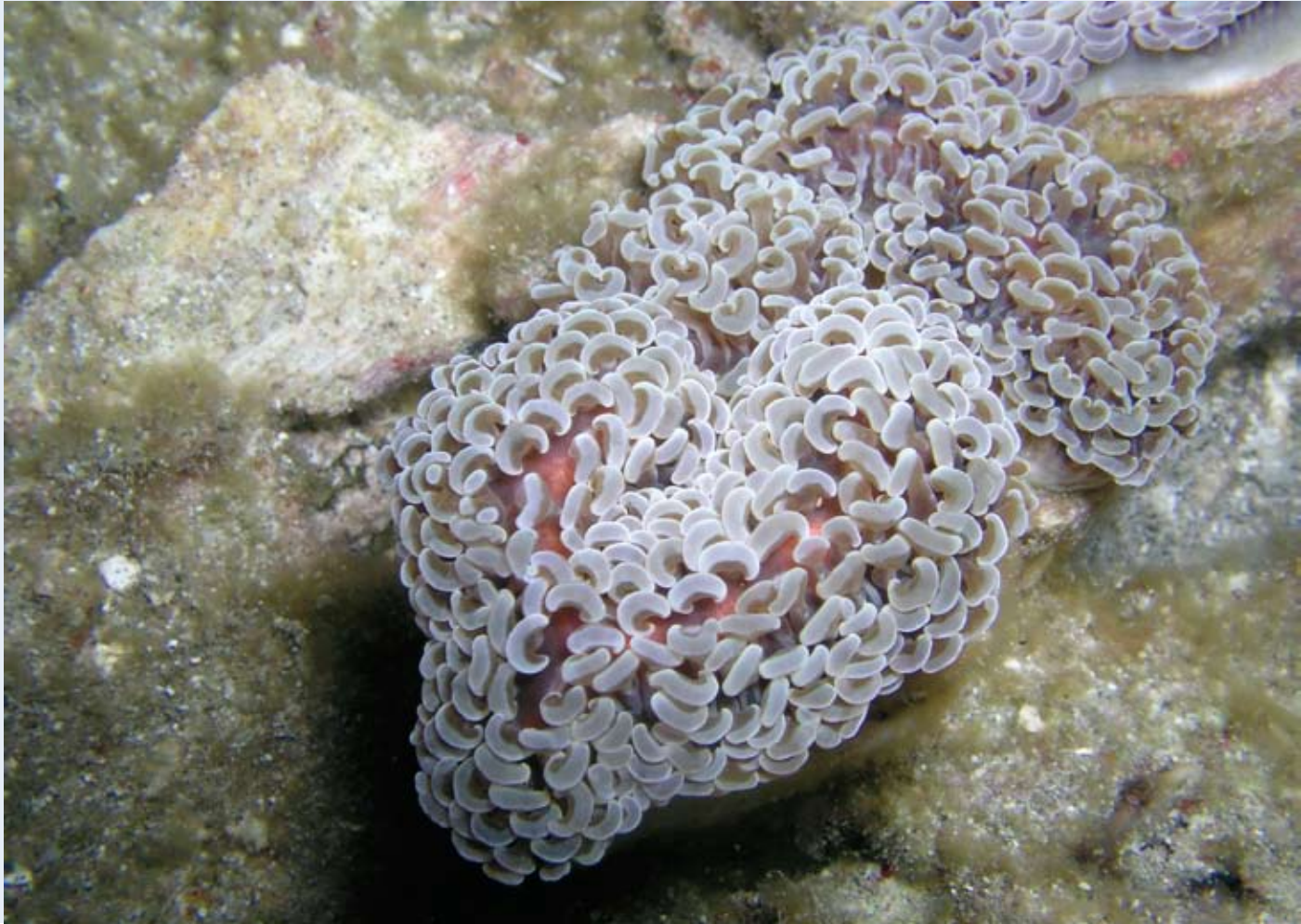
在雌株腎形珊瑚排卵前，可以看見珊瑚蟲的皮下有粉紅色的卵塊。