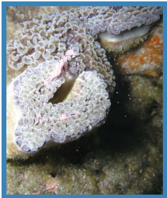
雌株腎形珊瑚正在排卵，卵粒呈粉紅色球狀。

珊瑚其實只是一群構造非常簡單的二胚層動物，牠們雖然擁有多樣的顏色與複雜的外觀，活體的部分卻只由很少的組織類型所組成。珊瑚具有神經細胞構成的簡單網狀的散漫神經系結構，神經細胞沒有集中形成腦。珊瑚也沒有特化的生殖器官，而是在生殖季開始時，由體壁的細胞特化為生殖腺。珊瑚缺乏特化器官，因此其有性生殖的調控先前並不為人所知。