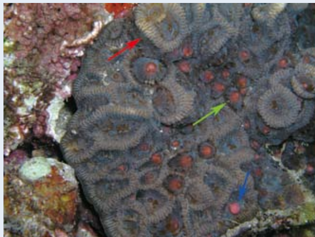
角菊珊瑚正要排放配子，紅色箭頭所指的是原珊瑚蟲於觸手內分成兩個珊瑚蟲的出芽生殖。綠色箭頭所指的是準備排放配子的珊瑚蟲，可以看見珊瑚蟲下的粉紅色配子。藍色箭頭所指的是剛排出珊瑚蟲體外的配子。